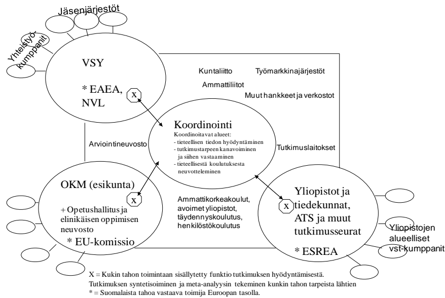
KUVIO 1. Ehdotus aikuiskoulutuksen tutkimuksen yhteistyön rakennemalliksi 4

Suunnitelmaa valmisteltiin vuosina 2010 ja 2011 kansallisissa tapaamisissa. Ohjelmalle on sovittu yhteiset tavoitteet ja toimintamuodot, joita ovat mm. kansalliset ja kansainväliset tutkijatapaamiset, erilaiset alueelliset tapaamiset ja tilaisuudet (mm. tutkiva opintokerho, sivistysiltamat), eri yliopistoista tulevien jatko-opiskelijoiden seminaarit, tutkimustulosten ja -tiedon kokoaminen ja levittäminen (mm. seminaarit ja julkaisut). Suunnitelmaan kuuluu yhteyksien rakentamisen pohjoismaisiin ja eurooppalaisiin sivistystyön tutkijayhteisöihin.