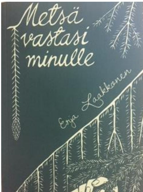
Erja Laakkosen runokirjan kuvitus on Sanna Hukkasen.

(itäisessä kielenparressa, karjalan kieltä mukaellen, sanan ”tuhma” merkitys on läheinen käsitteelle ”ajattelematon” )